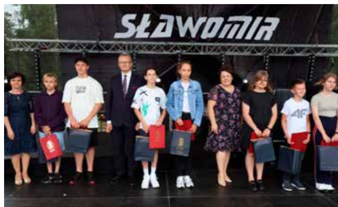
Nagrodzeni w konkursie literackim „Moja miejscowość w literaturze”.