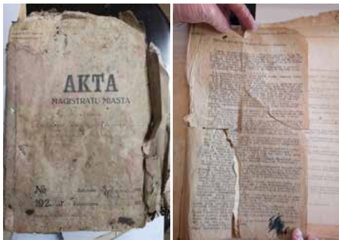
Z lewej: Jeden z obiektów muzealnych przeznaczonych do konserwacji - Akta magistratu miasta Zwolenia dotyczące spraw budowlanych i zatwierdzenia planów, MRZ/A/337; z prawej: Kolejny obiekt, który zostanie poddany pracom konserwatorskim - karta ze zbioru dokumentów dotyczących tzw. Fundacji Bogusza, MRZ/A/334.

Poza oczywistą funkcją praktyczną, zapiski odgrywają także ważną rolę w zachowaniu naszej historii – rodzinnej, miejskiej, narodowej, światowej. Zapewne w tej chwili Czytelnicy wyobrażają sobie przede wszystkim stare kroniki, opatrzone pieczęciami pergaminy i stopy akt urzędowych – i jest to jak najbardziej słuszną wizją nośników informacji o dziejach, choćby miasta Zwolenia, ale warto pamiętać, że cenne będą również osobiste notatki, pamiętniki, listy itp.