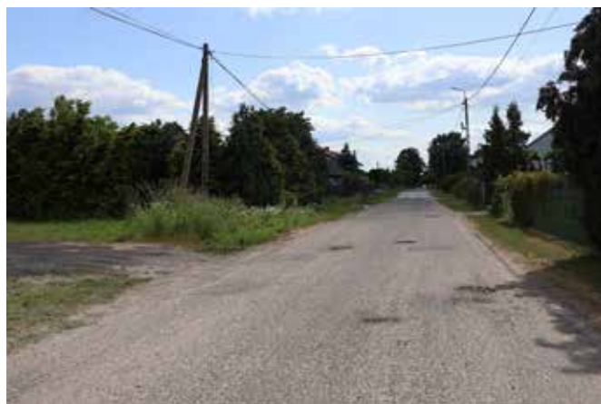
Droga w Strykowicach Górnych przed rozpoczęciem przebudowy.