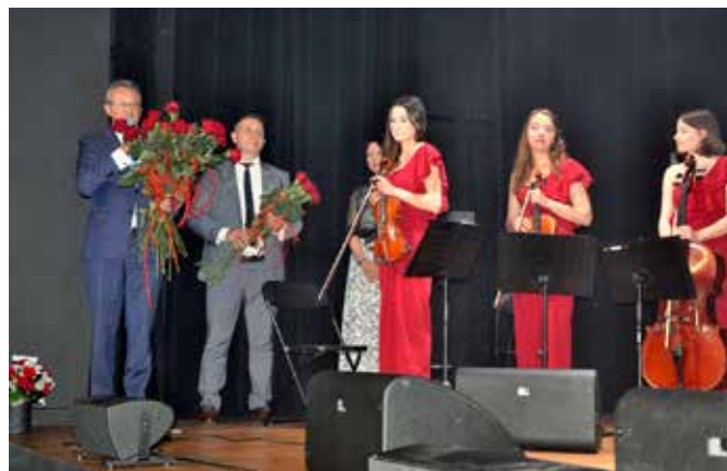
Burmistrz Zwolenia dziękuje za piękny, pełen niesamowitych emocji koncert.