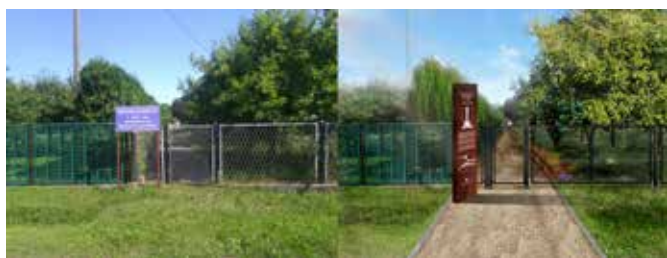
Wizualizacja zagospodarowania części nieruchomości prowadzącej do kapliczki Kochanowskich z terenem wokół zabytku. Rys. W. Knieć

Wizualizację koncepcji przygotowała inż. Weronika Knieć, asystent w Muzeum Regionalnym w Zwoleniu. Nie jest to jednak projekt architektoniczny, a próba nakreślenia potencjału, jaki tkwi w miejscu, budynkach i samej nieruchomości – m.in. parku i stawie.