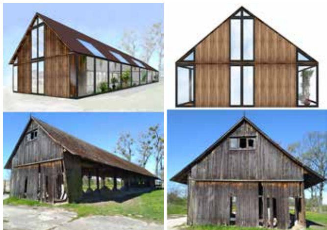
Wizualizacja wiaty-wozowni należącej do starostwa zwoleńskiego. Rys. W. Knieć.

Koncepcja dotycząca rewitalizacji Sycyny spodobała się Panu Marszałkowi na tyle, że wyraził chęć pomocy w odrestaurowaniu nieruchomości z przeznaczeniem jej na cele edukacyjno-wystawiennicze. Realizacja tego ambitnego i potrzebnego pomysłu wymaga też prowadzenia zmienionej polityki ekspozycyjnej i organizacyjnej przez jednostki muzealne z ziemi zwoleńskiej.