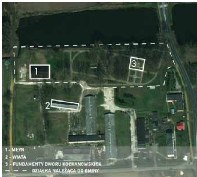
Zdjęcie lotnicze z zaznaczeniem budynków włączonych w rewitalizację nieruchomości w Sycynie.