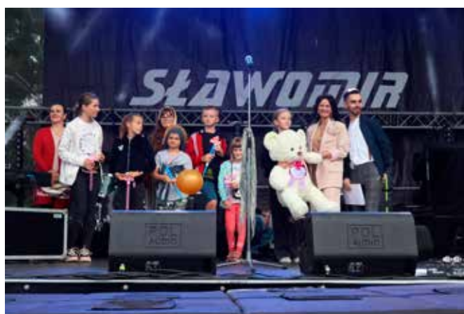
Uczestnicy konkursu na rymowanke o nagrodę Dyrektora Domu Kultury.