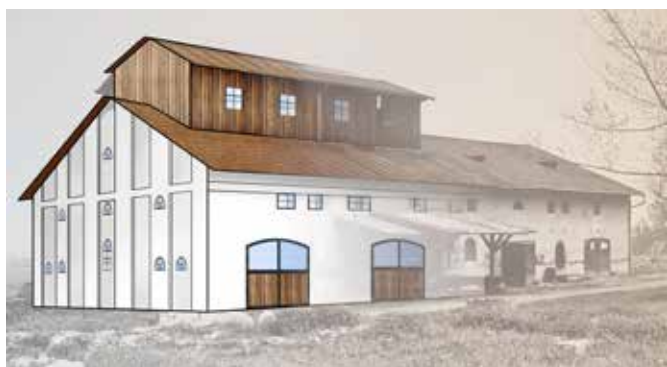
Trzy propozycje odrestaurowania zabytkowego spichlerza w Sycyni. Rys. W. Knieć.