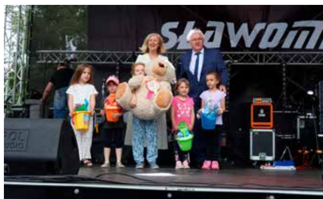
Zwycięzcy konkursu z zagadkami o nagrodę Starosty.

Zebraną publiczność jak zwykle zachwyił widowiskowy pokaz Młodzieżowej Orkiestry Dętej Miasta Zwolenia wraz z mażoretkami, która jest złotym medalistą World Music Contest w Kerkrade i oficjalnie uznaną piątą orkiestrą na świecie w marszu.