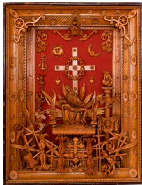
Wincenty Flak, Pieta, ok. 1943 r., zbiory MRZ