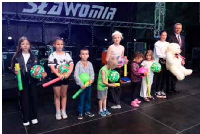
Nagrodzeni w konkursie „Jan Kochanowski, postać, życie i twórczość”. Nagrody w konkursie ufundował Burmistrz Zwolenia.