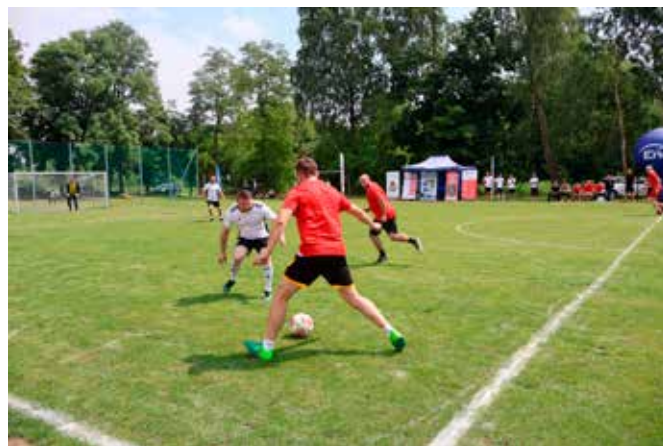
Na zdjęciu w czerwonych koszulkach zawodnicy z OSP Zielonka Nowa, w białych zawodnicy z KP PSP Zwoleń.

sze miejsce zajęła jednostka KPPSP Zwoleń, drugie OSP Jasieniec Solecki i trzecie OSP Zielonka Nowa. Rozegrany został również mecz Młodzieżowych Drużyn z OSP w Jasięcu Soleckim i Zielonce Nowej. To starcie zwyciężyła drużyna z Jasięca.