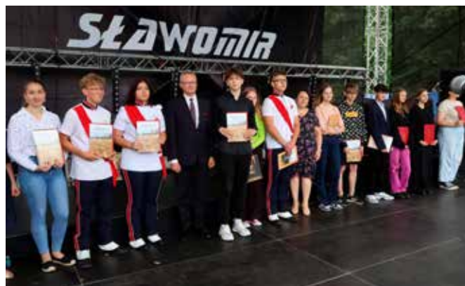
Laureaci XXIV Konkursu Wiedzy o Janie Kochanowskim.

Jak na Imieniny Pana Jana przystało, nie mogło też zabraknąć prezentacji młodych talentów. Na scenie wystąpiły duety taneczne oraz soliści Domu Kultury w Zwoleniu.