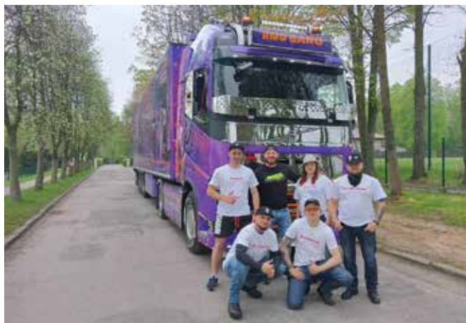
Wspólna fotografia organizatorów z Raptusem MG na tle jego słynnej ciężarówki.

Dalsza część zlotu miała charakter pikniku rodzinnego. Nad zalewem stanęły stoiska firm wspierających imprezę, budki z jedzeniem, a dla najmłodszych dmuchańce i wiele innych atrakcji. Odwiedzający to miejsce mogli obejrzeć piękne motocykle, sportowe auta, ale też niespotykane klasyki oraz zabytki.