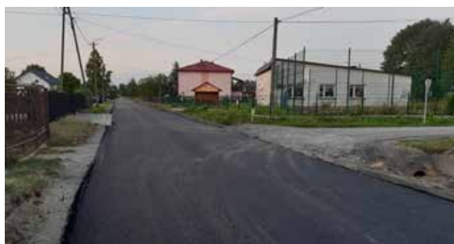
Droga w Strykowicach Górnych w trakcie trwania prac