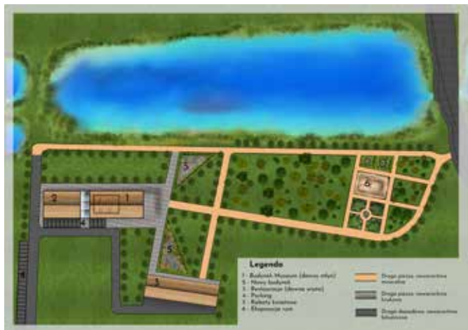
Projekt zagospodarowania terenu w Sycyni: zabytkowy park z fundamentami dworu Kochanowskich, młynem-spiczlerzem, stawem "Przerywaniec". Rys. W. Knieć.