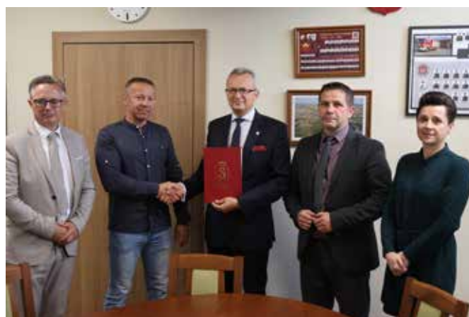
14 czerwca została również podpisana umowa na inspektora nadzoru. Nad prawidłowym przebiegiem prac będzie czuwała firma ZNAK.