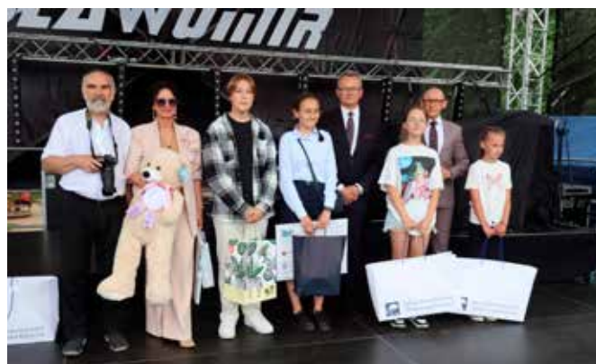
Zwycięzcy wraz z fundatorami nagród w konkursie plastycznym „Klimaty wiejskie w utworach poety”.