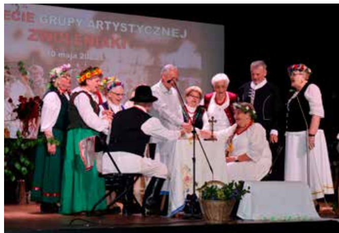
Artyści z okazji jubileuszu wystąpili na scenie w programie pod tytułem „Ojczysty dom”.

Każdy jubileusz skłania do refleksji oraz wspomnień. Z tej okazji podczas spotkania wyświetlono prezentację multimedialną, podsumowującą działalność zespołu. Następnie artyści wystąpili na scenie w programie pod tytułem „Ojczysty dom”.