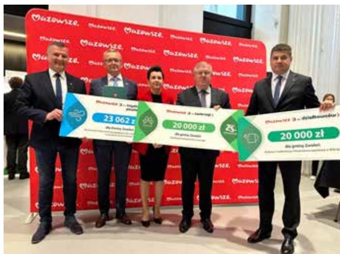
Wśród beneficjentów, którzy otrzymają dofinansowanie z Mazowsza znalazła się gmina Zwolenia.