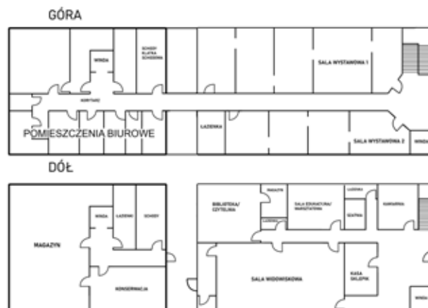
Rzut - plan zagospodarowania wnętrza spichlerza po remoncie.